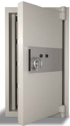
Sicherheitseinstufungen für Tresorräume

Euro V • Euro VIII-EX-KB • Euro X-EX-KB • Euro XI-EX-KB